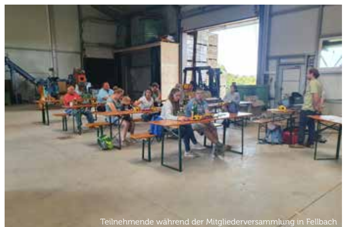
Teilnehmende während der Mitgliederversammlung in Fellbach