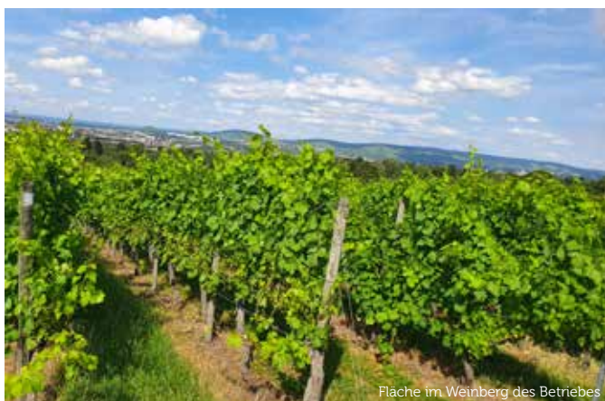
Fläche im Weinberg des Betriebes