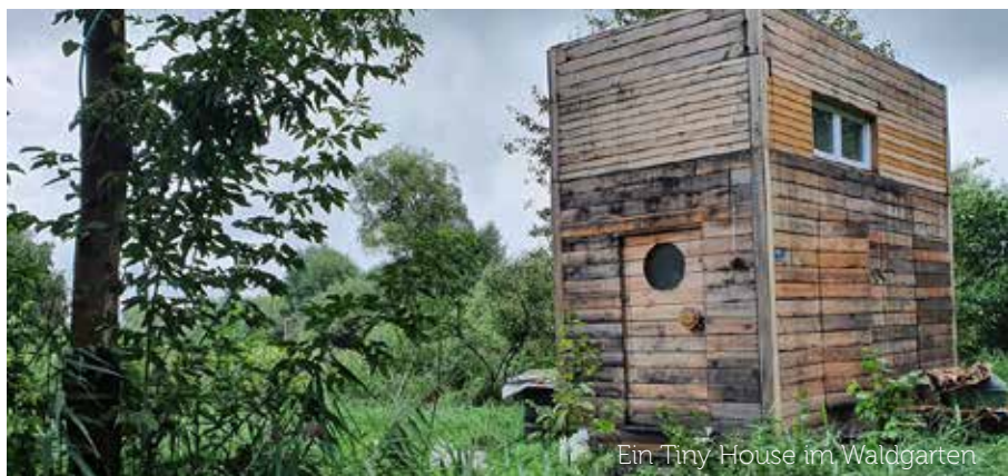
Ein Tiny House im Waldgarten

Ob Waldgärten eine kleine Nische für ökologisch Engagierte bleiben, oder ähnlich an Fahrt aufnehmen werden wie die Urban-Gardening-Bewegung, wird sich zeigen. Das Interesse scheint jedenfalls zu wachsen. Das sieht man schon daran, dass der Klassiker „Einen Waldgarten erschaffen“ von Martin Crawford Gesellschaft bekommen hat. In diesem September ist im Haupt-Verlag der ,Praxisratgeber Waldgarten, von Volker Kranz und