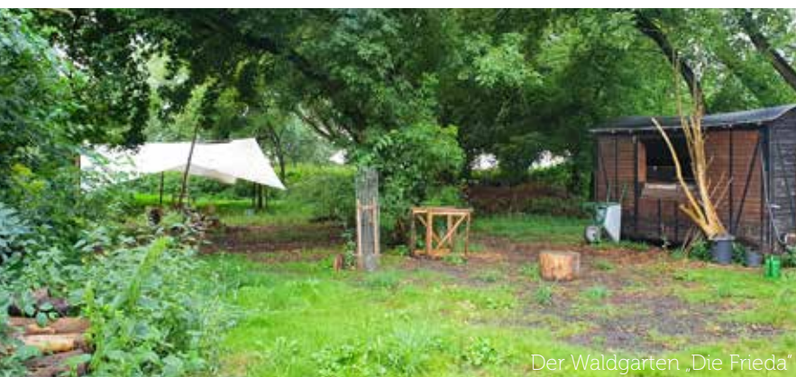
Der Waldgarten „Die Frieda“