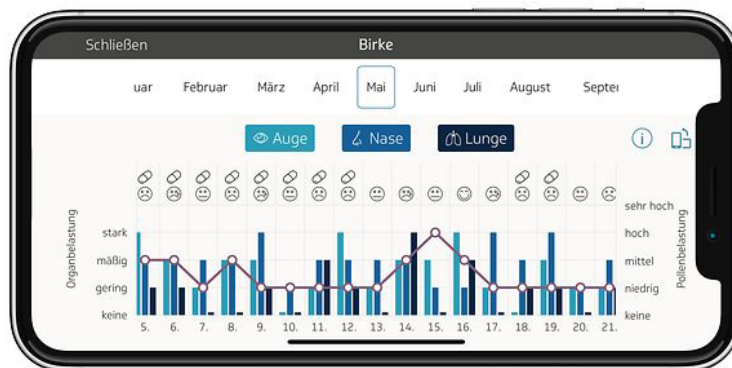
Auswertungsscreen: Darstellung der Organbelastung, des Gesamtbefindens sowie der eingenommenen Medikamente in Abhängigkeit vom Pollenflug

Mit Ambrosia, Beifuß, Birke, Erle, Esche, Gräser, Hasel und Roggen deckt die „Husteblume“ die häufigsten Pollenallergene ab. Die Prognose für die Belastung kommt direkt vom Deutschen Wetterdienst, der deutschlandweit die Daten der über 45 Messfallen der Stiftung Deutscher Pollendienst (PID) auswertet. Dort wird gemessen, wie viele Pollen sich in einem Kubikmeter Luft befinden und daraufhin ermittelt, wie hoch die Belastungsintensität sein wird.